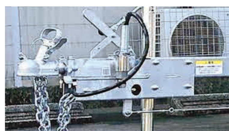
慣性ブレーキモデルなので けん引できる車両の幅が広がります