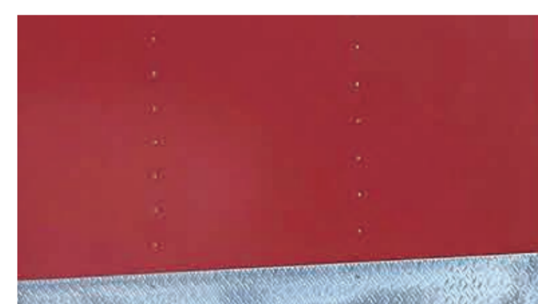
ボディ外装色は20色から選べます