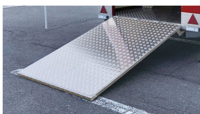
標準装備のバックドアはスロープとして 使用できます