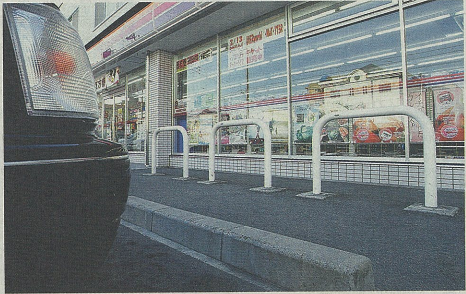
アクセルとブレーキの踏み間違えでコンビニへ車が突っ込む事故を防ぐため、設置する店舗が増えているパイプ柵。名古屋昭和区塩付通で